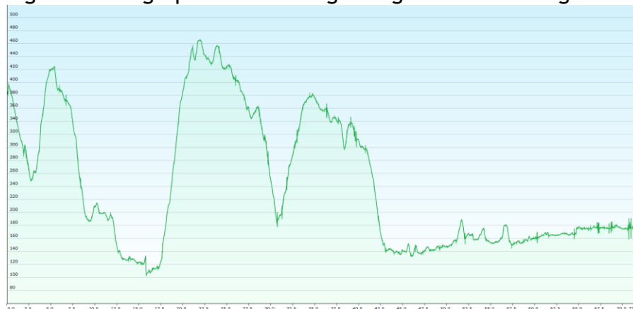
Figuur 2. Hoogteprofiel Nibelungenweg: Vielbrunn-Bürgstadt-Wertheim-Tauberbischofsheim

De Nibelungenweg loopt al vanaf de Donnersberg grotendeels parallel met de E8. Het stuk tussen Vielbrunn en Wertheim is een fraaie wandeling die grotendeels door bossen voert. Je gaat dan eerst naar Bürgstadt (22 km) en daarna naar Wertheim (27 km) in oostelijke richting. Vanaf Wertheim kun je zuidwaarts de gemarkeerde E8 volgen of langs de Tauber de eveneens gemarkeerde fietsroute "Liebliches Taubertal" volgen naar Tauberbischofsheim om daadwerkelijk aan te sluiten op de Romantische Strasse. Er zitten drie klimmetjes in de route, maar die zijn goed te doen. Het laagste punt ligt op 100m, het hoogste punt top 460m.