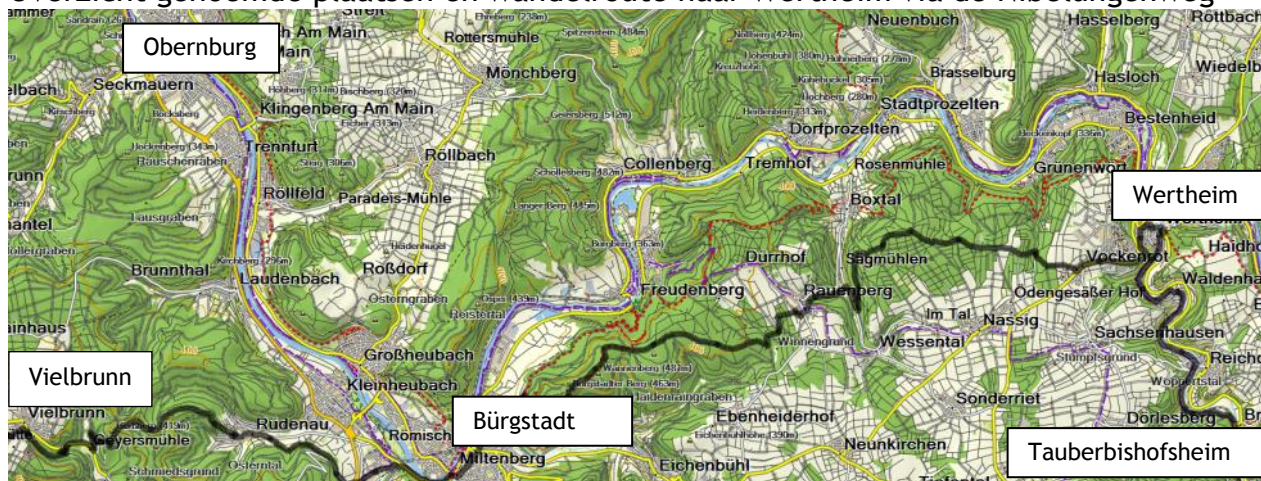
Figuur 1. Overzicht genoemde plaatsen en wandelroute naar Wertheim via de Nibelungenweg

De Nibelungenweg loopt al vanaf de Donnersberg grotendeels parallel met de E8. Het stuk tussen Vielbrunn en Wertheim is een fraaie wandeling die grotendeels door bossen voert. Je gaat dan eerst naar Bürgstadt (22 km) en daarna naar Wertheim (27 km) in oostelijke richting. Vanaf Wertheim kun je zuidwaarts de gemarkeerde E8 volgen of langs de Tauber de eveneens gemarkeerde fietsroute "Liebliches Taubertal" volgen naar Tauberbischofsheim om daadwerkelijk aan te sluiten op de Romantische Strasse. Er zitten drie klimmetjes in de route, maar die zijn goed te doen. Het laagste punt ligt op 100m, het hoogste punt top 460m.