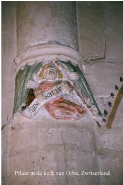
Pilaar in de kerk van Orbe, Zwitserland