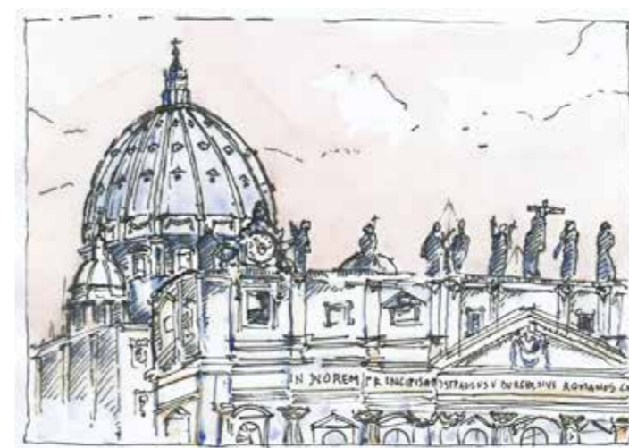
Tekening Ben Teunissen

Een andere manier om te achterhalen waar pelgrims en bedevaartgangers vandaan kwamen zijn geschreven bronnen, zoals het Mirakelboek in de Sint-Jan van 's-Hertogenbosch. Vanaf 1382, toen het miraculeuze Mariabeeld werd gevonden en de bron was van vele wonderen, ontstond er een stroom van bedevaartgangers die hun lichamelijke ongemakken door Maria wilden laten genezen. Het eerste wonder in het Mirakelboek staat beschreven op 5 november 1382. Een jaar later staan er reeds 288 genoteerd: bijna een per dag! De inkomsten van de pelgrims zorgden ervoor dat de bouw van deze gotische kerk snel vorderde. Dat is een wonder op zich.