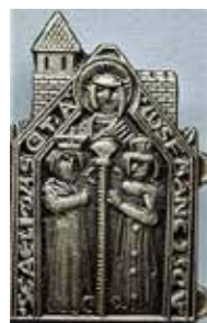
Een replica van het zeldzame insigne van de heilige Elisabeth van Thüringen of Elisabeth van Hongarije (1234). Deze is te koop voor de pelgrims op het Elisabethpad dat leidt naar haar graf in de basiliek van Marburg Duitsland.

De pelgrimsinsignes waren vaak kerkelijk van aard, maar ook waren het soms profane afbeeldingen met platte beeltenissen van geslachtsdelen of seksuele handelingen. Pelgrimstekens en profane speldjes werden door iedereen gedragen. De tekens en speldjes slaan een brug tussen hogere en lagere cultuur, en tussen de religieuze en profane wereld.