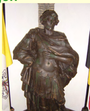
'en dit is dus die St. Juliaan'

De stichting ontplooit vele activiteiten. Zo is er de Vlaamse Culturele Kring, met als doelstelling: bevordering van kunst en wetenschap, met name op het terrein van de Nederlandse letteren. Zij bevordert ontmoetingen met vooraanstaanden op dit terrein, zoals bijvoorbeeld Minister Eyskens, Jef Geeraerts, Willem Vermandere, Godfried Bomans, Godfried Danneels, e.v.a. Ook de Orde van de Prince komt regelmatig in Sint Juliaan bijeen, een orde, genoemd naar Willem van Oranje, die de saamhorigheid tussen alle Nederlandstaligen en bevordering van de eenheid van de Nederlandse taal en cultuur beoogt. Daarnaast organiseert de kerk ook elk jaar een reeks barokconcerten, die zich in een toenemende populariteit mogen verheugen. Maar naast al deze activiteiten is en blijft het doel van de Stichting