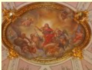
'Verheerlijking van St. Juliaan, 1717'