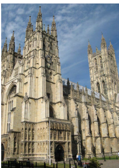
Kathedraal van Canterbury, start Via Francigena; geschiedenis gaat terug tot 6e eeuw.

Mooie en bijzondere foto's? Stuur ze ons met uw verhaal! [Hier]